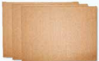
Láminas de cartón corrugado