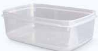
Táper de plástico