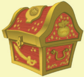
Coffre au trésor