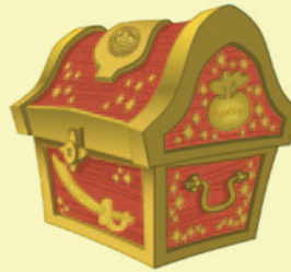
Coffre au trésor