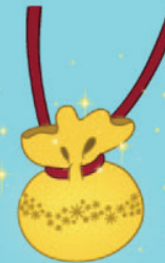
Poussière de fée