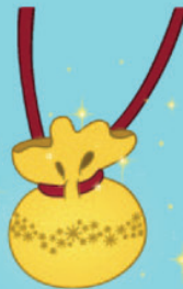
Poussière de fée