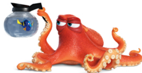
DORY ET HANK