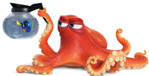
DORY ET HANK