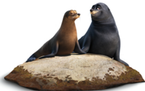
FLUKE ET RUDDER